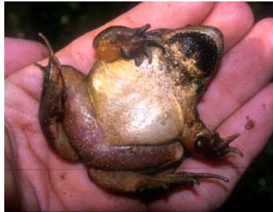
Macho con papilas negras en garganta y miembros anteriores.