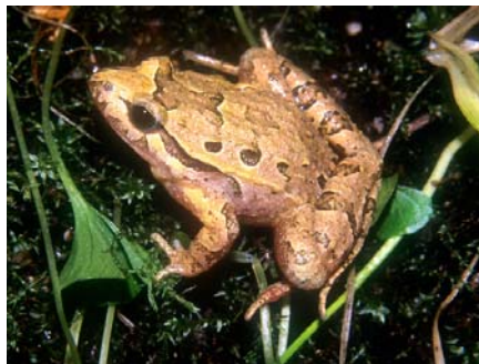
Individuo con manchas irregulares en el dorso.