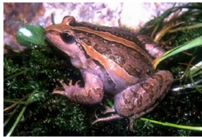
Individuo con bandas dorsales longitudinales.